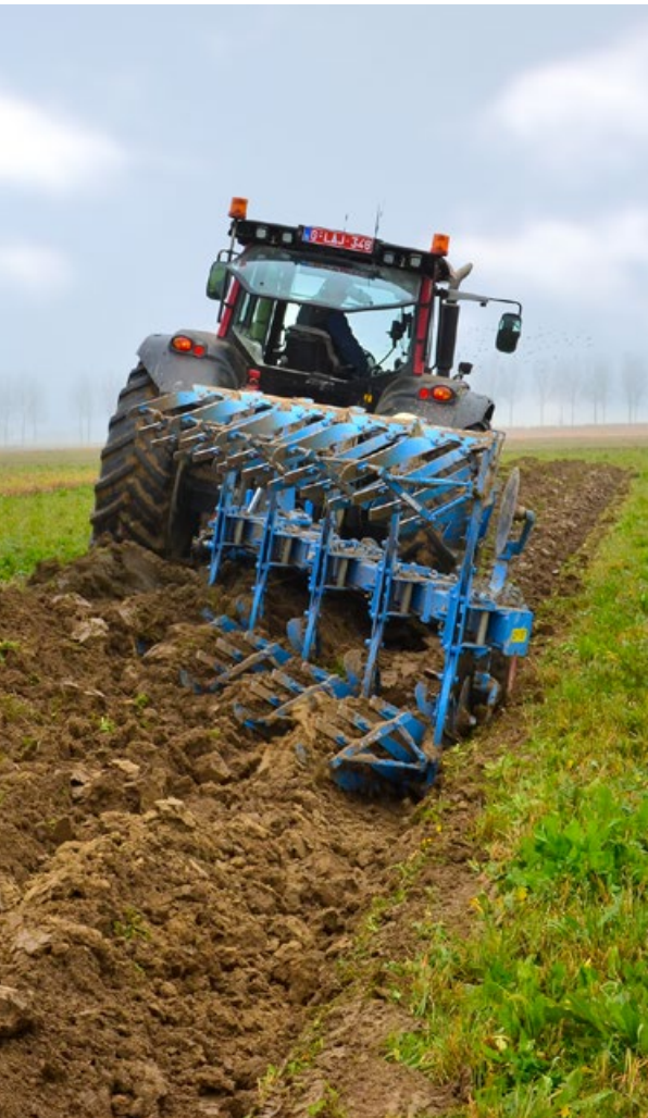
Aanleg van een keverbank in Boekhout