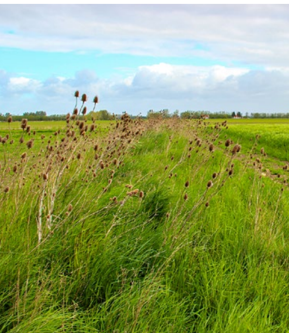
Keverbank in Ramskapelle