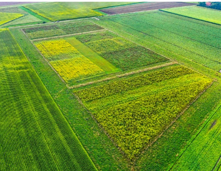
Perceel opgedeeld in bloemenblokken