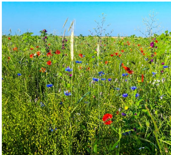
Een bloeiende bloemenblok